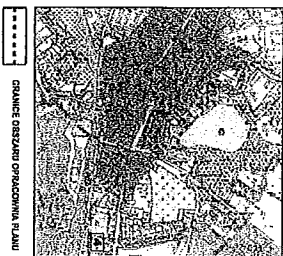
GRANICE OBSZARU OPACOWANIA PLANU

WYNIK ZE STUDIUM WYKONANIA I KIERUNKÓW ZAGOSPODAROWANIA PRZESTRZENNEGO