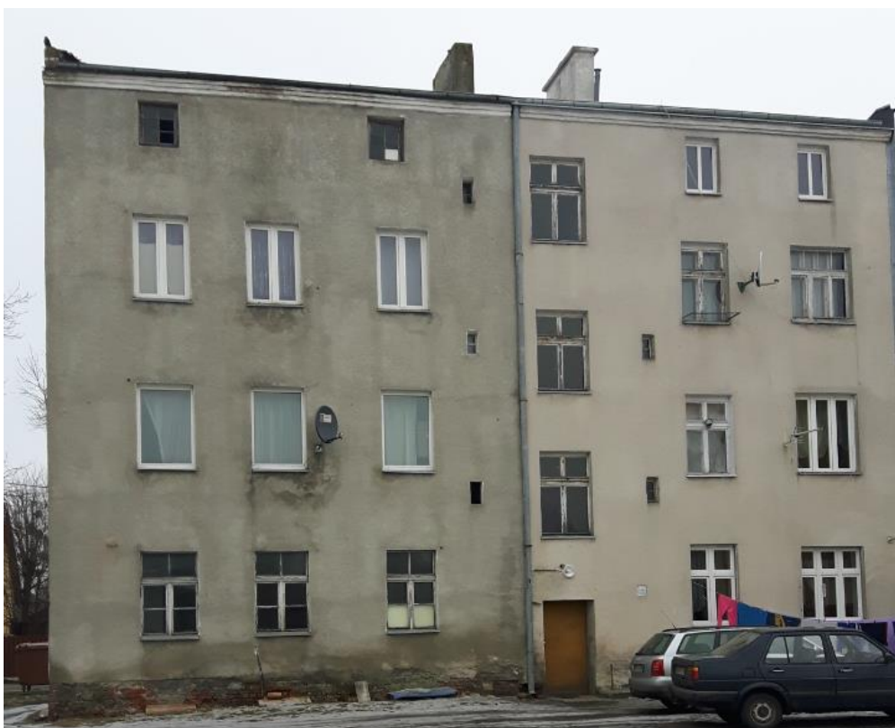
Fot.3. Kętrzyn, budynek mieszkalny ul. Ogrodowa 8 – elewacja tylna.