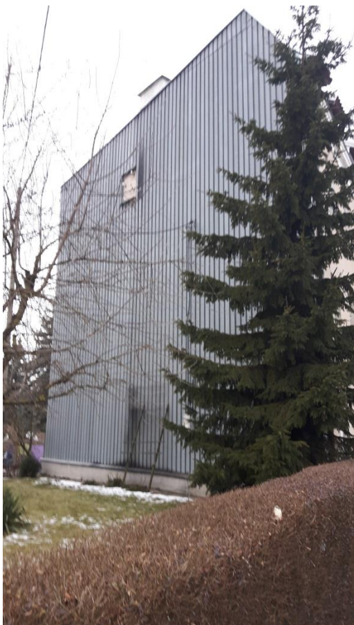
Fot.2. Kętrzyn, budynek mieszkalny ul. Ogrodowa 8 – elewacja boczna.