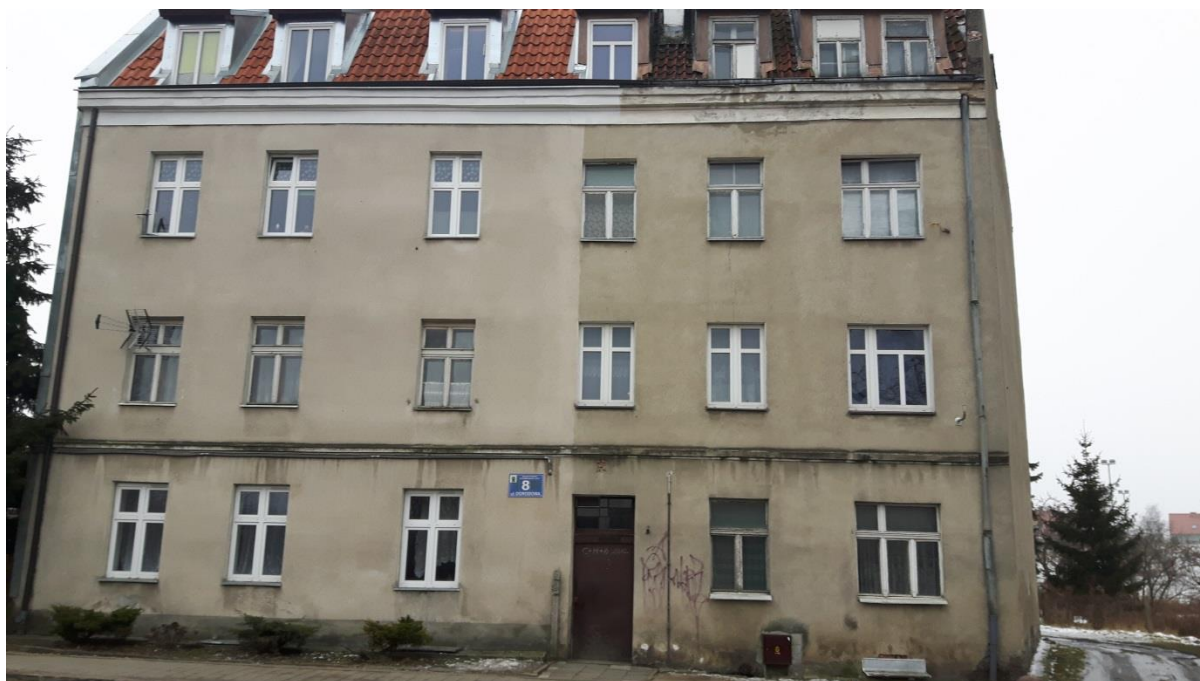
Fot.1. Kętrzyn, budynek mieszkalny ul. Ogrodowa 8 – elewacja frontowa, stan obecny.

Budynek znajdujący się przy ul. Ogrodowej 8 charakteryzuje się wysokim stopniem zużycia elewacji. Po dokonaniu oględzin stwierdzono liczne odspojenia i spękania tynku, odspojenia malatur na budynku. Zły stan części okien i drzwi zewnętrznych. Konstrukcja dachu w stanie dobrym po remoncie, jego pokrycie po wymianie, odwodnienie liniowe dachu z blachy stalowej ocynkowanej zużyte, nie nadające się do użytku. Budynek kwalifikuje się do wykonania docieplenia.