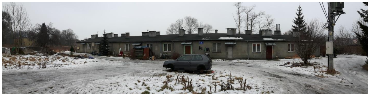
Fot.1. Kętrzyn, budynek mieszkalny ul. Cukrownicza 2 – elewacja frontowa, stan obecny.

Budynek znajdujący się przy ul. Cukrowniczej 2 charakteryzuje się wysokim stopniem zużycia elewacji. Po dokonaniu oględzin stwierdzono liczne odspojenia i spękania tynku, odspojenia malatur na budynku. Konstrukcja dachu i jego pokrycie w stanie dobrym, odwodnienie liniowe dachu z blachy stalowej ocynkowanej nie nadające się do użycia. Budynek kwalifikuje się do wykonania docieplenia. Zaobserwowano liczne dobudówki drewniane i częściowo wyburzone narożniki dobudówki części tylnej.