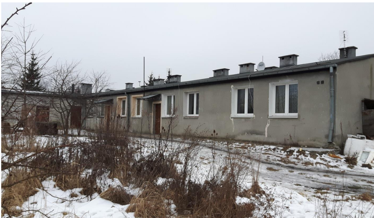
Fot.3. Kętrzyn, budynek mieszkalny ul. Cukrownicza 2 – elewacja tylna, stan obecny. Fot. J.Baran.