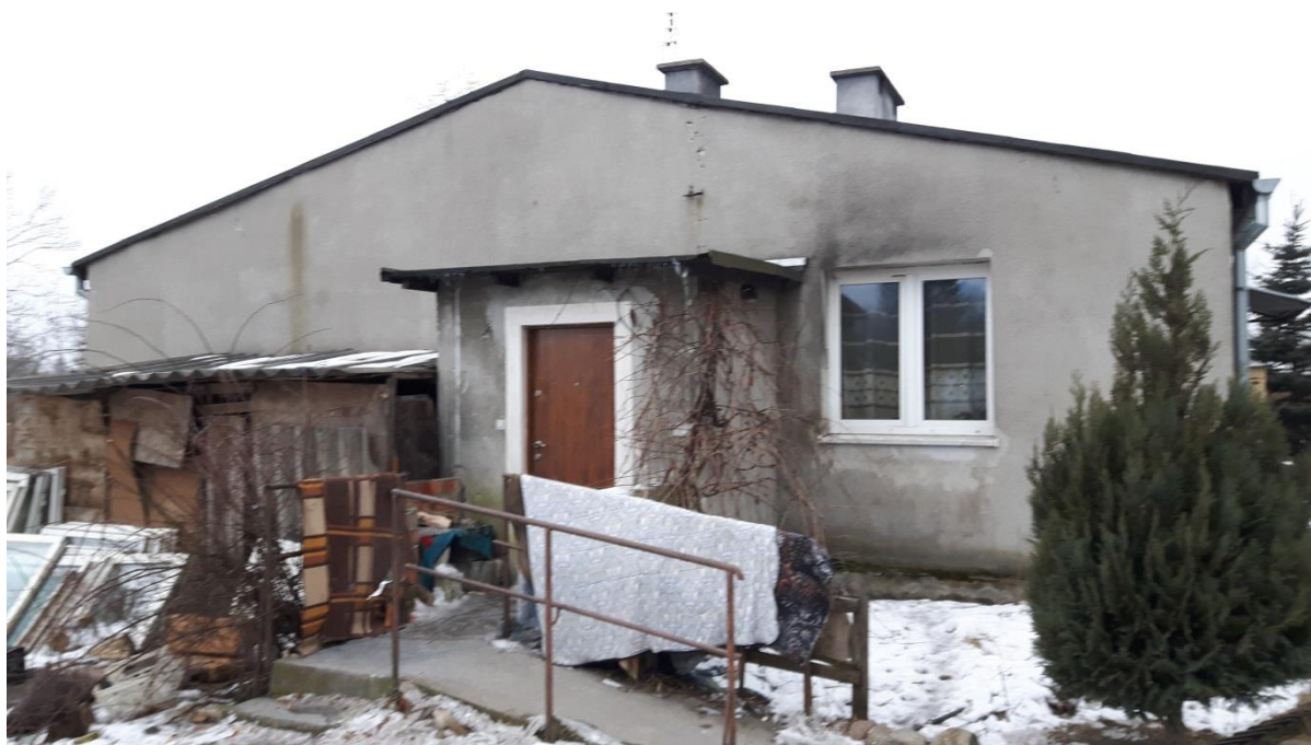
Fot.2. Kętrzyn, budynek mieszkalny ul. Cukrownicza 2 – elewacja boczna, stan obecny.