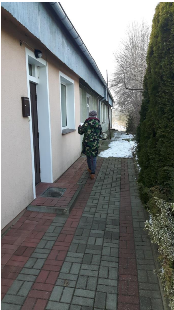
Fot.2. Kętrzyn, budynek mieszkalny ul. Zatorze 7 – elewacja tylna.