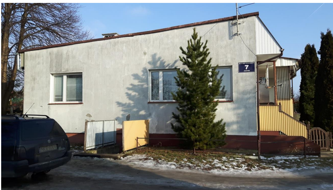
Fot.3. Kętrzyn, budynek mieszkalny ul. Zatorze 7 – elewacja boczna.