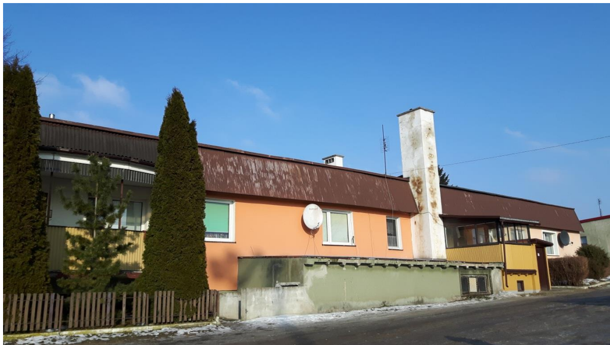
Fot.1. Kętrzyn, budynek mieszkalny ul. Zatorze 7 – elewacja frontowa, stan obecny.

Budynek znajdujący się przy ul. Zatorze 7 charakteryzuje się wysokim stopniem zużycia elewacji w części tylnej i bocznej. Po dokonaniu oględzin stwierdzono liczne docieplenia budynku o różnych grubościach. Zły stan części okien. Konstrukcja dachu w stanie niedostatecznym, jego pokrycie kwalifikuje się do wymiany, odwodnienie liniowe dachu z blachy stalowej ocynkowanej zużyte, nie nadające się do użytku. Chałupniczo wykonane docieplenia budynku. Budynek kwalifikuje się do wykonania docieplenia.